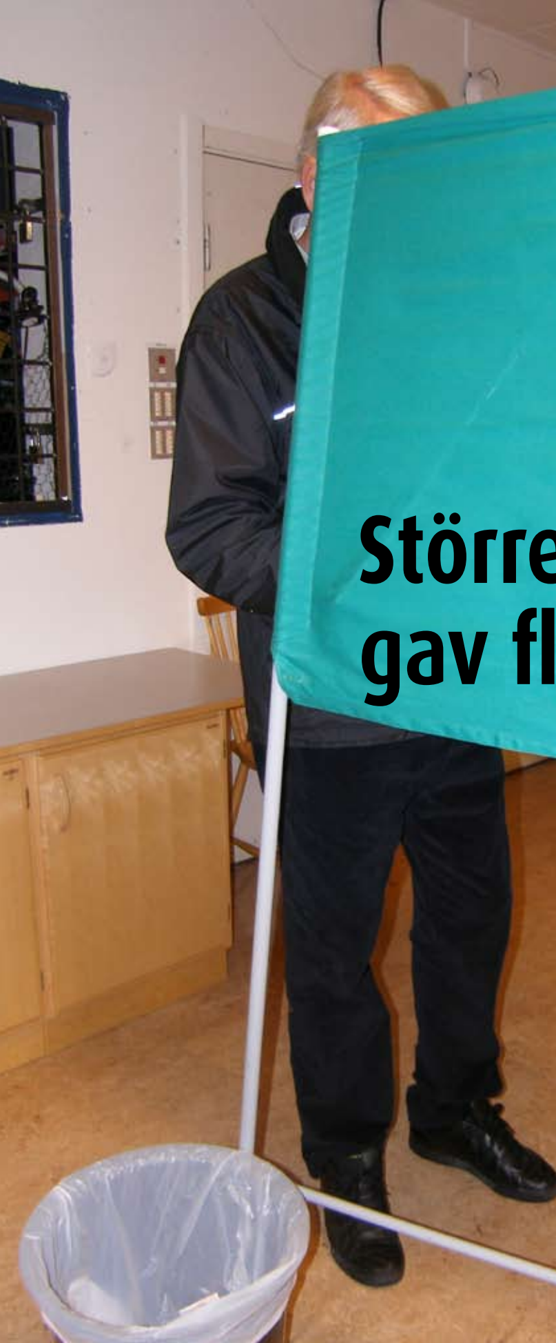
Till valet 2006 var det premiär för förtidsröstning i lokaler i kommunal regi.

Vid 2006 års val övergick ansvaret för förtidsröstningen från Posten AB till landets kommuner. Nya forskningsresultat visar att även små förändringar kan ha en effekt på valdeltagandet.